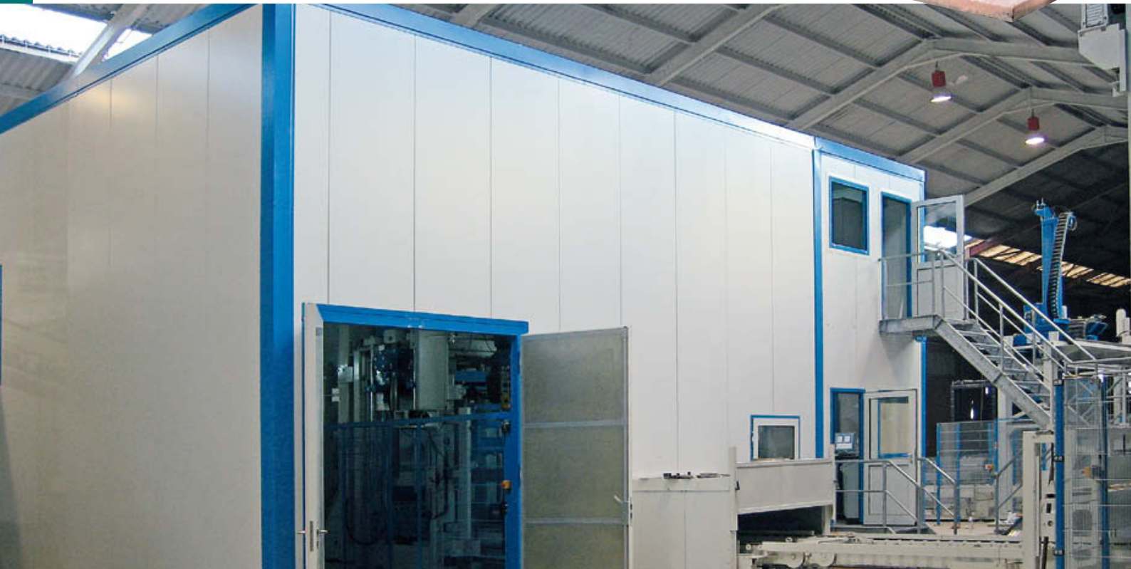
Maschinenverkleidung mit angebauter Steuer- und Schaltschrankkabine für Neuanlagen und Nachrüstung.