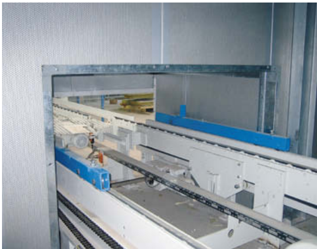
Schallschutztunnel für Brettzuführung und -weiterführung. Bei unterschiedlichen Steinhöhen mit höhenverstellbarem Schiebeelement.

Für die Maschinen- und Kabinenverkleidung bietet das selbsttragende ROTHO-System genügend Spielraum für die Realisierung jeder maßgeschneiderten Konzeption. Die erprobten Sandwichelemente gewährleisten hervorragende Schallschutzeigenschaften.