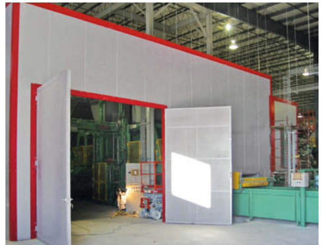
Toranlagen, Fenster und Öffnungen können individuell angeordnet werden.

Für die Maschinen- und Kabinenverkleidung bietet das selbsttragende ROTHO-System genügend Spielraum für die Realisierung jeder maßgeschneiderten Konzeption. Die erprobten Sandwichelemente gewährleisten hervorragende Schallschutzeigenschaften.